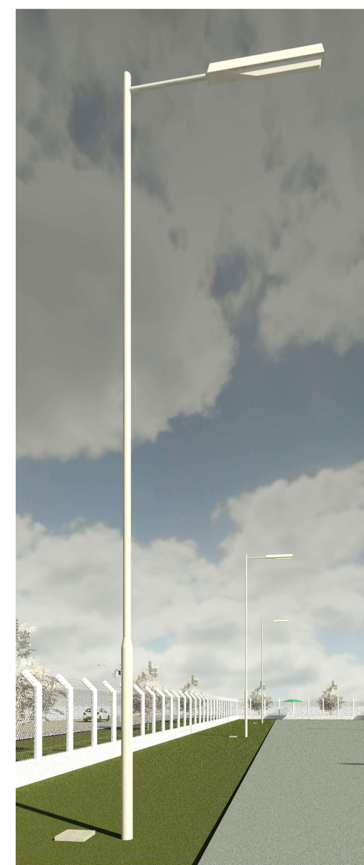
DETALHE DO POSTEAMENTO