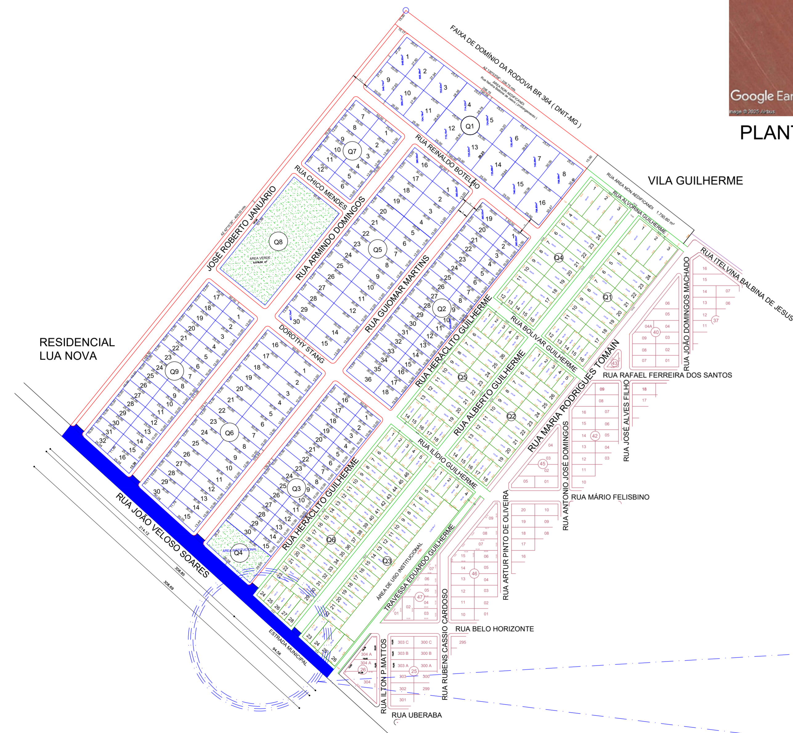
PLANTA DE LOCALIZAÇÃO S/ESCALA